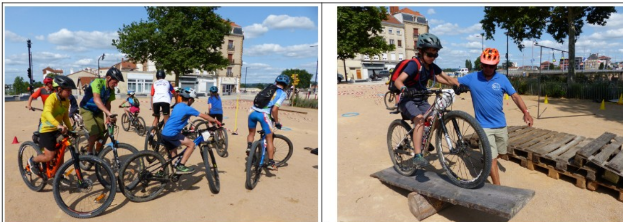
Carré magique et maniabilité à Roanne Plage

Parmi les activités communes avec la semaine fédérale, en plus du défilé d'ouverture, on peut évoquer la journée pique nique. Autre temps fort l'après midi démonstration de maniabilité à Roanne plage avec quelques carrés magiques.