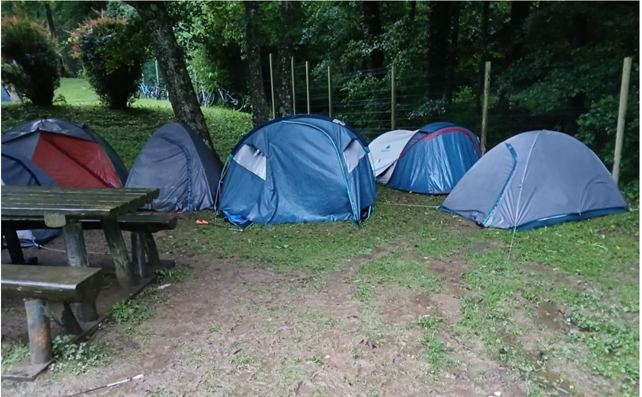
Notre campement après l'orage tentes détrempées sol boueux, mais il faut tout de même plier les tentes pour attaquer la dernière étape.

Cet épisode a mis bien à mal le moral de plus d'un participants de la Bike to Roanne et la majorité a réalisé la dernière étape en voiture. Notre club accompagné d'un club de l'Essonne a su mobiliser et encourager 7 jeunes pour terminer la Bike to Roanne en VTT. Sur les 70 jeunes, 7 finishers dont 6 de l'Isle d'Abeau, bravo à eux.