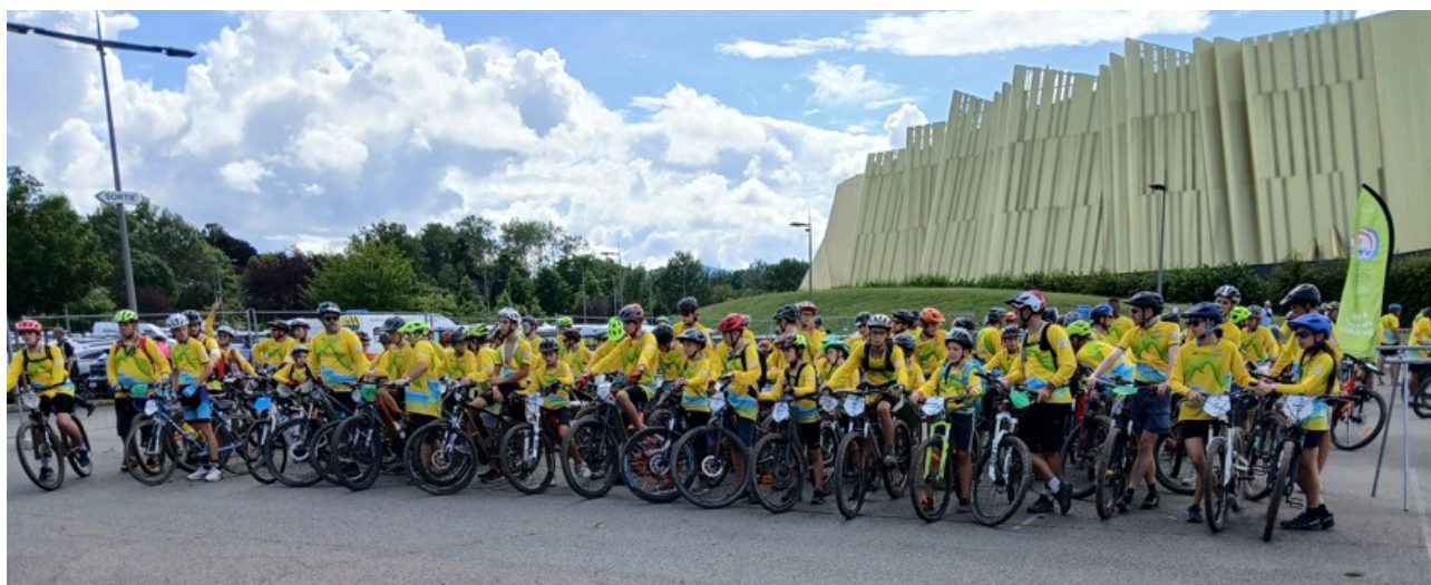
Les 200 jeunes à côté du scarabée prêts pour la parade d'ouverture de la semaine fédérale

Cette année le séjour des jeunes des écoles VTT a pris une forme innovante. L'hébergement comme les fois précédentes, s'est fait sous la tente, par contre le séjour était lui découpé en deux périodes, la première réalisée sous forme d'un trajet en itinérance de trois jours, nommé « Bike to Roanne ». La deuxième sous forme d'un rassemblement jeunes au sein de la semaine fédérale avec nos aînés soit prêt de 200 jeunes mêlés aux 7 000 participants.