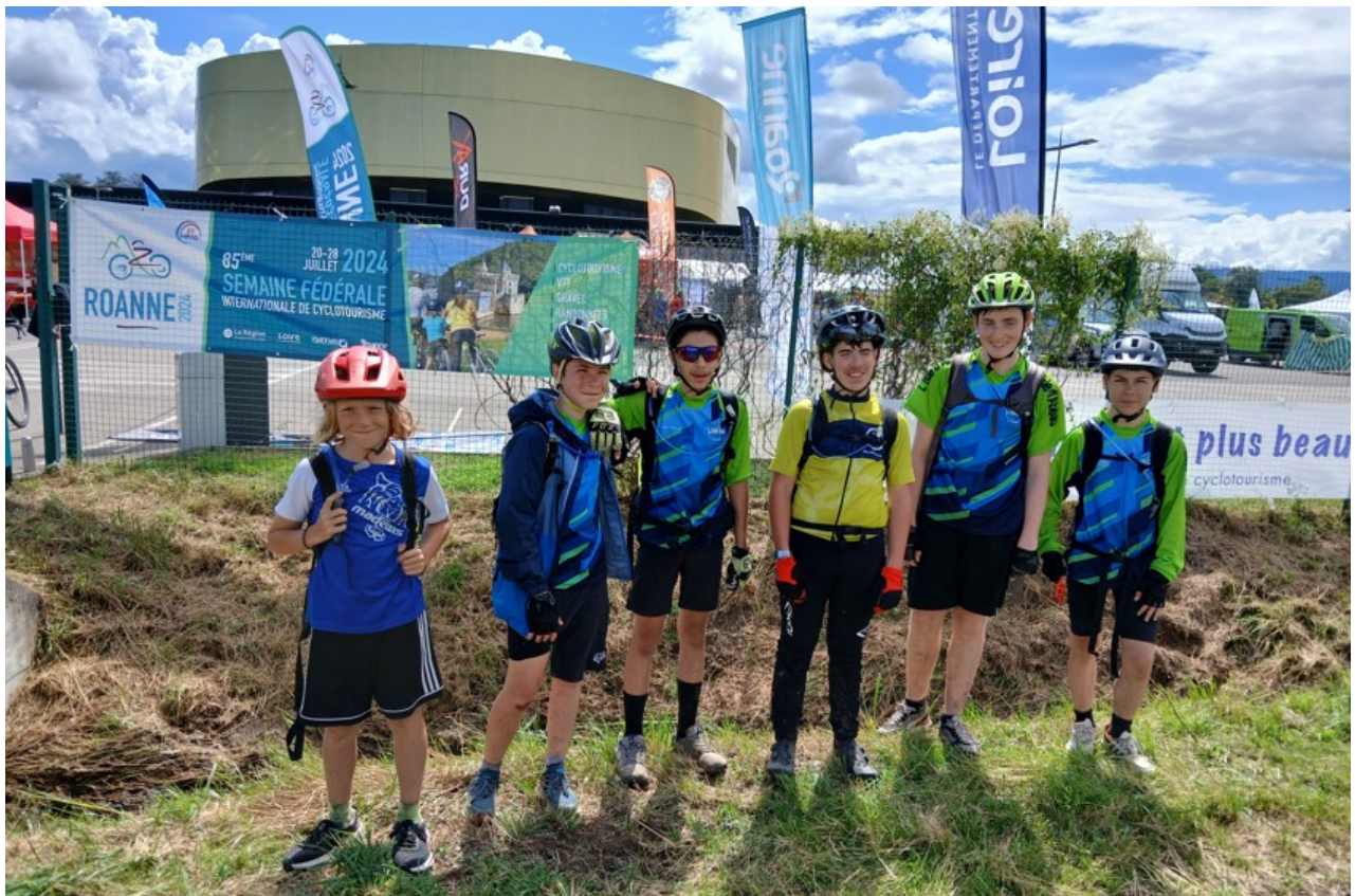
Notre arrivée au scarabée à Roanne

A peine arrivé à Roanne, réception de nos maillots aux couleurs de la semaine fédérale pour aller participer au défilé des jeunes au Scarabée lors des cérémonies d'ouvertures. Le scarabée est un espace événementiels à proximité de Roanne et qui a été le point central et de rassemblement pour