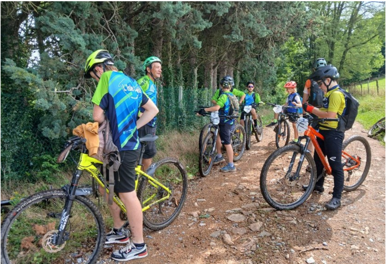
L'équipe des finishers du Bike to Roanne