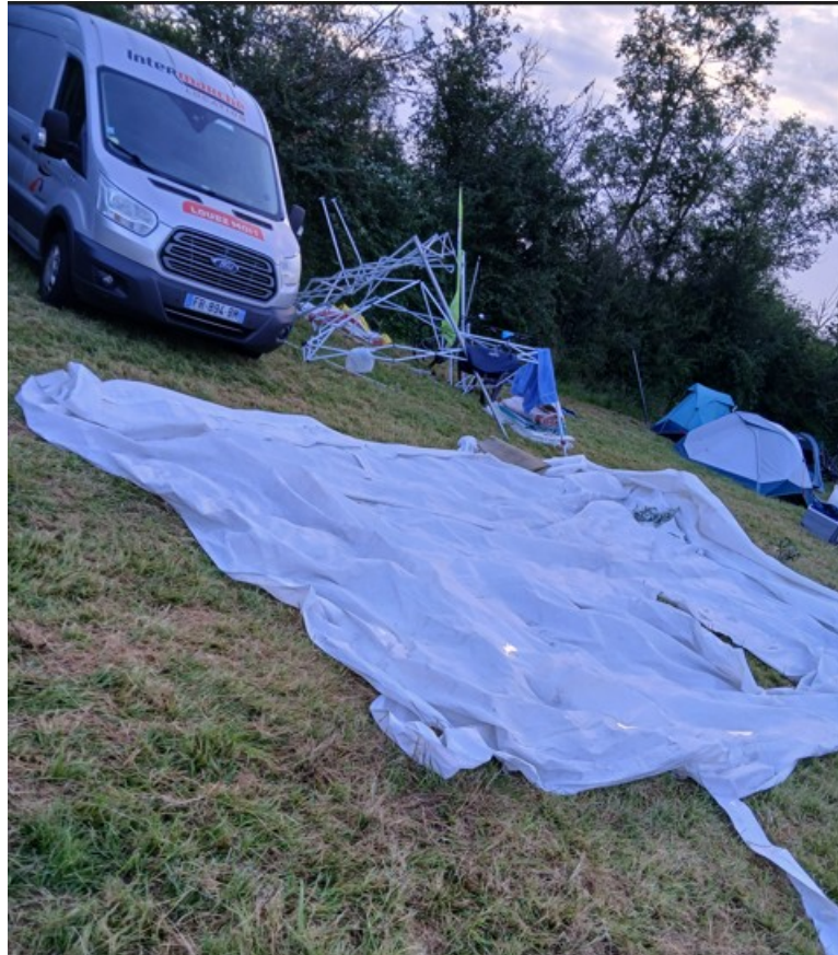
A Roanne petit aperçu des dégâts dus à l'orage