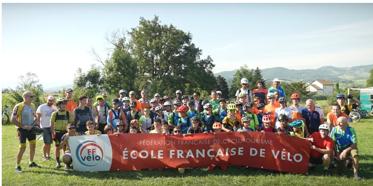
Les jeunes participants à la Bike to Roanne le matin du deuxième jour

Cette année le séjour des jeunes des écoles VTT a pris une forme innovante. L'hébergement comme les fois précédentes, s'est fait sous la tente, par contre le séjour était lui découpé en deux périodes, la première réalisée sous forme d'un trajet en itinérance de trois jours, nommé « Bike to Roanne ». La deuxième sous forme d'un rassemblement jeunes au sein de la semaine fédérale avec nos aînés soit prêt de 200 jeunes mêlés aux 7 000 participants.