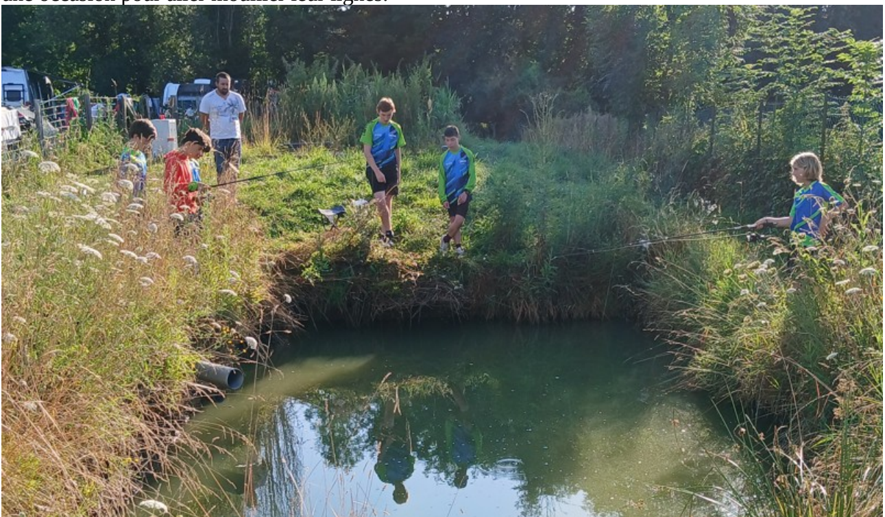
Toutes les occasions sont bonnes pour nos pêcheurs

Parmi les activités extra vélo n'oublions pas la pêche avec nos deux experts qui n'ont pas manqué une occasion pour aller mouiller leur lignes.